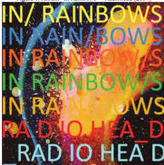
Figura 1. Álbum “In Rainbows” - Radiohead (2007)

Em maio e junho de 2006, a banda faz uma turnê pelas principais cidades da Europa e América do Norte, apresentando muitas das canções novas, o que serviu de laboratório para as gravações finais.