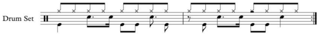
Figura 5. Transcrição Bateria M3